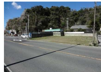
南東側市道越しに西方向に撮影