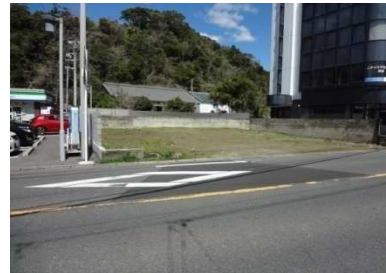
南東側市道越しに北方向に撮影